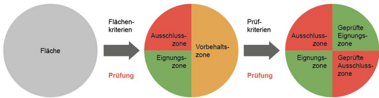
Abb. 1: Darstellung des Ablaufs der Zonierungsplanung für eine naturverträgliche Standortsteuerung.