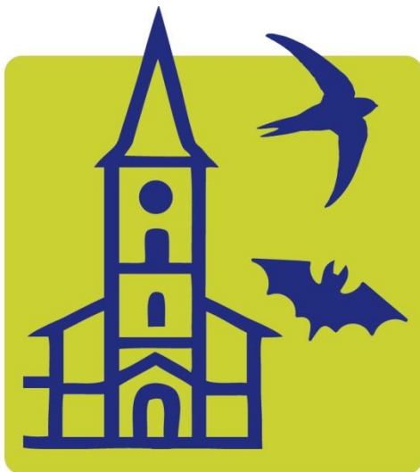
Foto: Logo des Projekts Kirchturmtiere.at