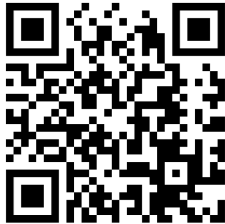
Foto rechts: QR-Code für das Herunterladen der App naturbeobachtung.at/ Projekt Kirchturmtiere.